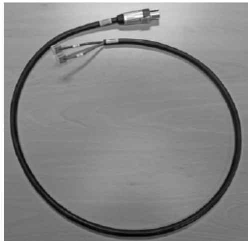
Bild 2 Stecker mit erhöhter Schutzart und 1,5 m Kabel

Es ist keine höhere Auflösung vorhanden.