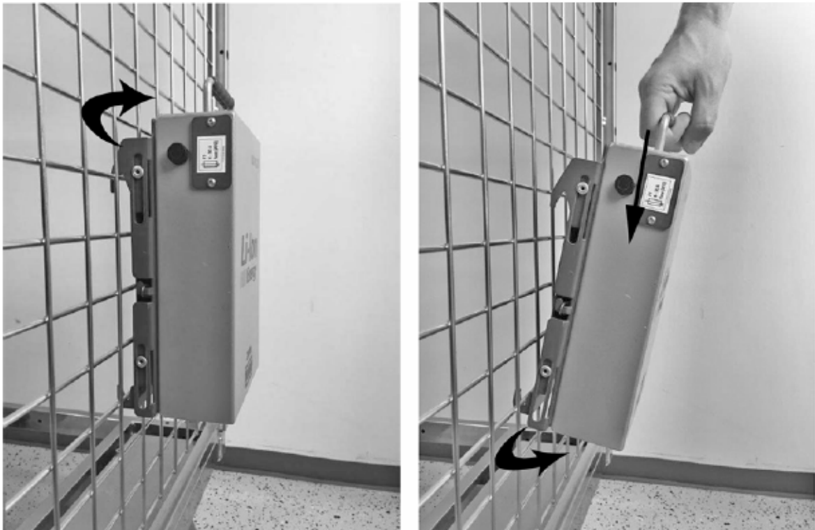
Bild 13 Selbstverriegelnde Variante

Es ist keine höhere Auflösung vorhanden.