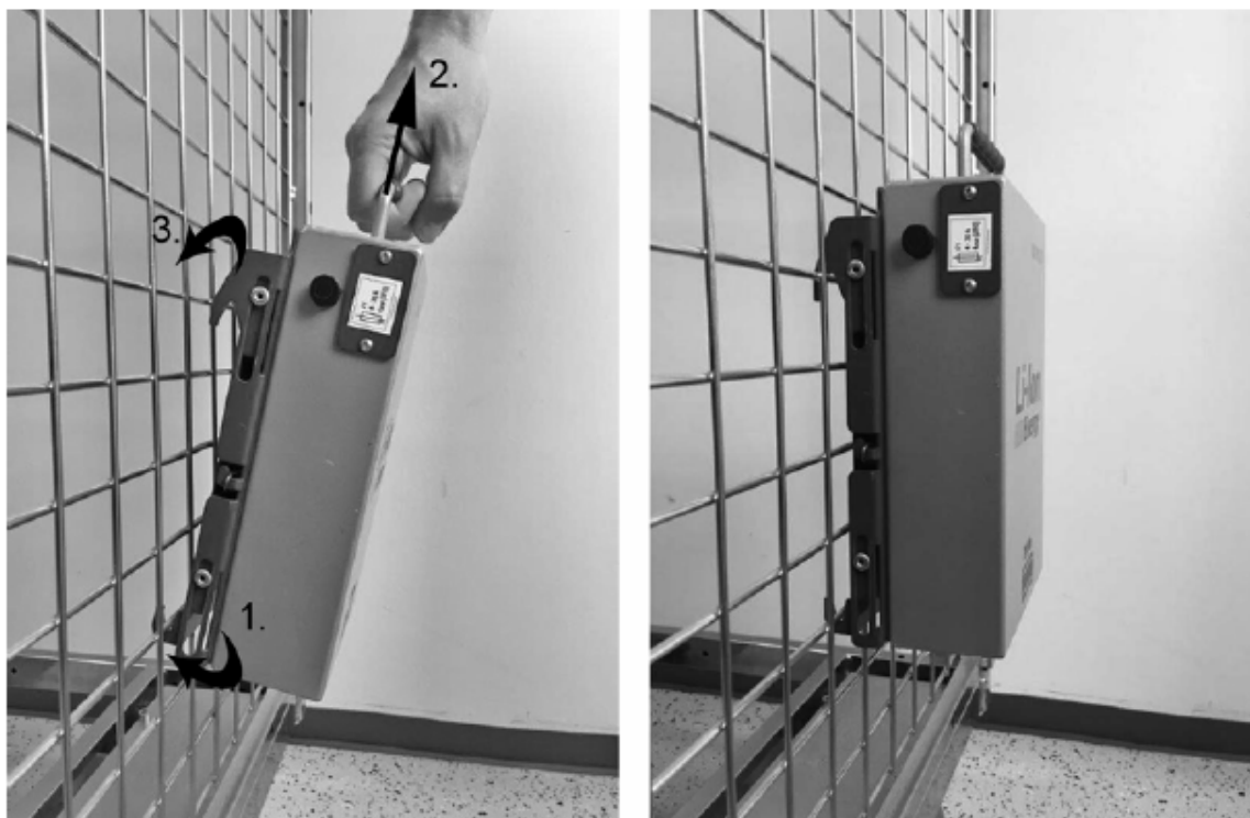
Bild 8 Selbstverriegelnde Variante

Es ist keine höhere Auflösung vorhanden.