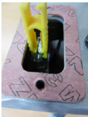
Bild 6 Entnehmen Sie mit der Zange die Sicherung. Tauschen Sie gegen eine Passende aus und setzen Sie diese wieder mit der Zange ein.

Es ist keine höhere Auflösung vorhanden.