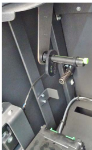
Bild 36 Rollenhalter ohne Papierbestückung