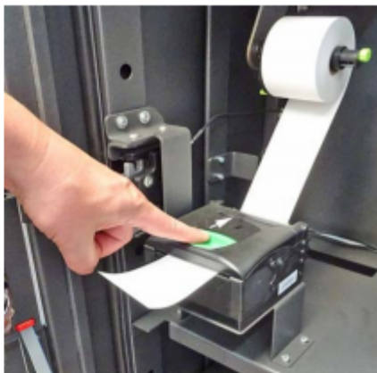
Bild 41 Drücken Sie den grünen Betätigungshebel zum Schrankinneren bis sich die Klappe Bild 41 öffnet.

Der Papierschnitt erfolgt nach erfolgreichem Einzug automatisch.