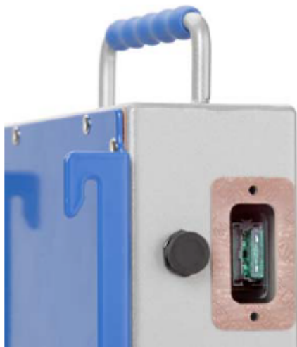
Bild 4 Überprüfen Sie den korrekten Sitz und die Qualität der Dichtung. Gegebenenfalls neue originale Dichtung verwenden.

Es ist keine höhere Auflösung vorhanden.